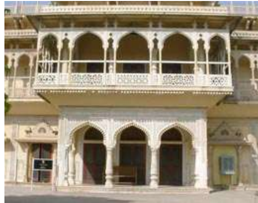
Jaipur © Christophe Roux - Inde : le Rajasthan