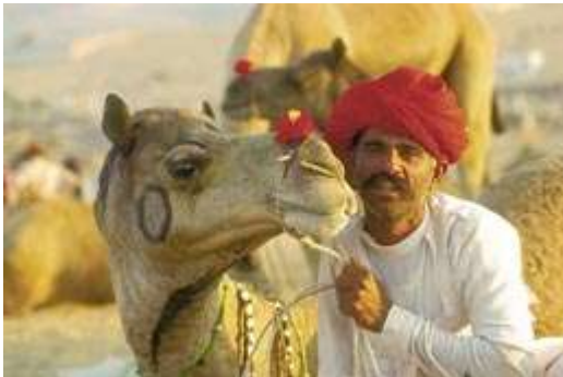
Foire aux chameaux de Pushkar - Inde : le Rajasthan