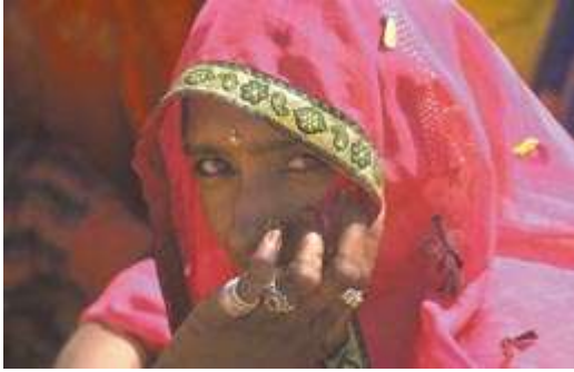
Inde : le Rajasthan