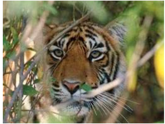
Tigre - Inde : le Rajasthan